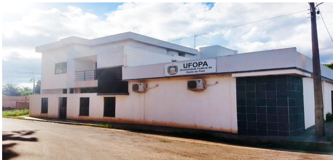
Figura 1 – Universidade Federal do Oeste do Pará - Campus Itaituba